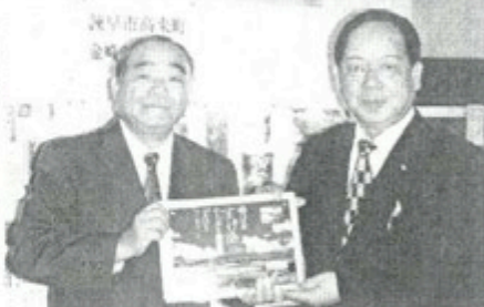
石垣開催の第3回サミットに向けて、エンブレムを受け取った長崎県五島市富江町（左）と長崎県五島市富江町

すけ漁は海岸に石垣を取り残された魚を生け捕り、干潮時に石垣内に築き、干潮時に石垣内に取り残された魚を生け捕りにする古来から伝わる漁法で、白保では2006年に海垣を復元した。同サミットは、白保の海垣復元の際、白保中学校の生徒がインターネットで大分県宇佐市長洲中学校の取り組みを知り、手紙を送ったことがきっかけ。手紙のやりとりを知った同協議会が宇佐市を訪れて交流が始まり、昨年3月に第1回サミットが宇佐市で開催された。