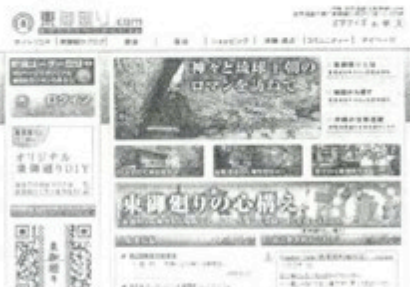
東御廻り.comのホームページ